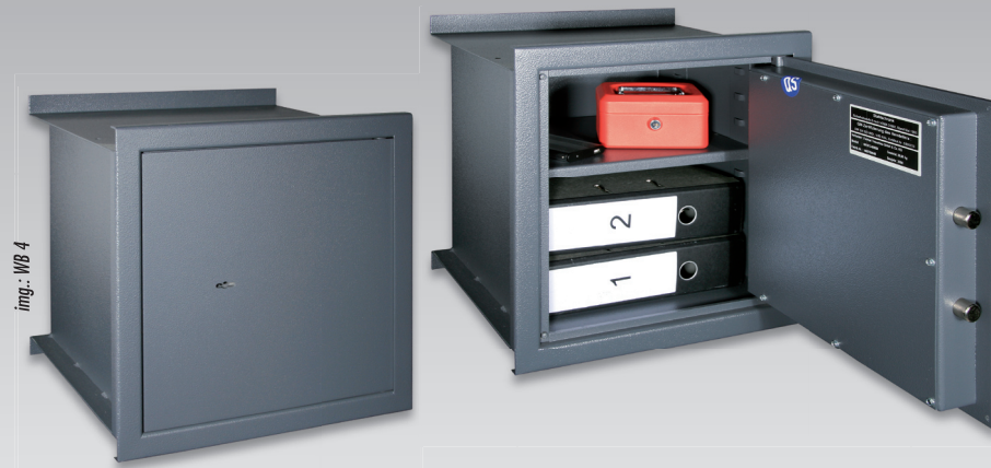
img.: WB 4

La structure de ce coffre-fort mural autorise aussi des boîtiers de petites dimensions avec protection contre les effractions selon le degré de sécurité « B ». Le montage doit être réalisé selon les règles de l'art par un spécialiste.