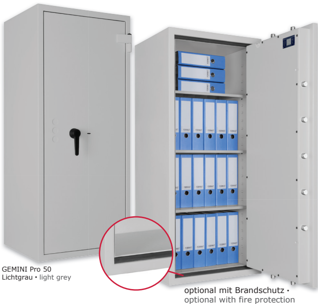
GEMINI Pro 50 Lichtgrau • light grey

Wertschutzschrank, Grad I (EN 1143-1) Safe, Grade I (EN 1143-1)