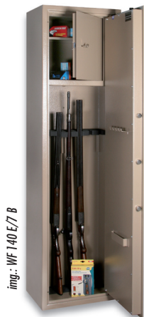
img.: WF 140 E/7 B

Safe Dry – Luftentfeuchter mit natürlichem Speichergranulat und Feuchte-Anzeiger. Im Schutzkarton verwendbar. Abtropfsicher und am Heizkörper regenerierbar. Artikel-Nr. A1015284 – VE 16 Stk.