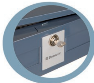
Schloß zur sicheren Aufbewahrung