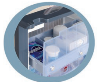
Schubladen sorgen für Ordnung und Schutz vor Wärmeeintritt bei Türöffnung

Ersetzt ab sofort DS 600 H! DS 600 H nicht mehr lieferbar.