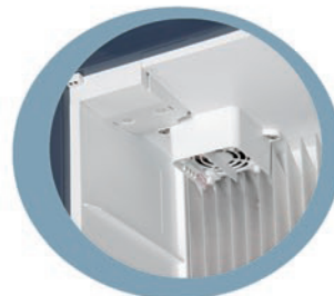
Lüfter für konstantes Temperaturniveau