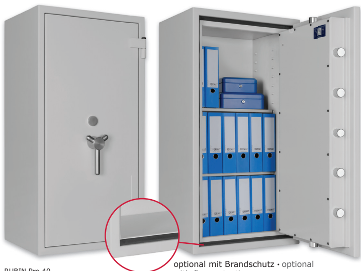
RUBIN Pro 40 Lichtgrau • light grey Dekoration nicht im Lieferumfang enthalten • decoration not included in the delivery optional mit Brandschutz • optional with fire protection

Wertschutzschrank, Grad III (EN 1143-1) Safe, Grade III (EN 1143-1)