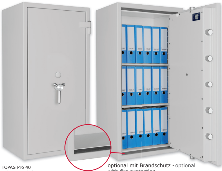
TOPAS Pro 40 Lichtgrau • light grey optional mit Brandschutz • optional with fire protection Dekoration nicht im Lieferumfang enthalten • decoration not included in the delivery

Wertschutzschrank, Grad II (EN 1143-1) Safe, Grade II (EN 1143-1)