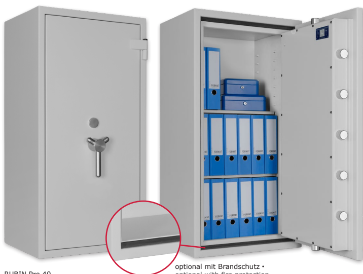
RUBIN Pro 40 Lichtgrau • light grey Dekoration nicht im Lieferumfang enthalten • decoration not included in the delivery

Wertschutzschrank, Grad III (EN 1143-1) Safe, Grade III (EN 1143-1)